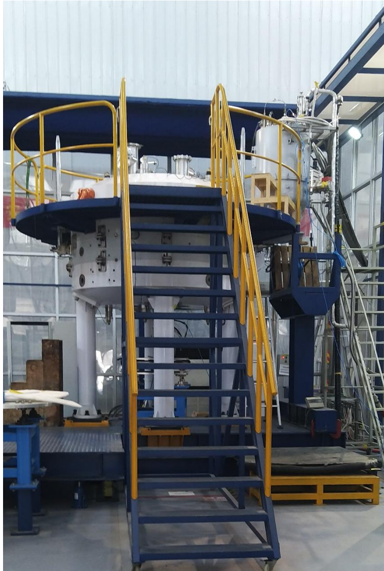
Рисунок 1 Циклотрон SC200

Сейчас сверхпроводящий циклотрон SC200 для г. Хэфэй находится в стадии отладки (см. Рисунок 1). Основные системы изготовлены и испытаны. Был проведен тест питания высокой мощности для ВЧ (высокочастотной) ускоряющей системы. ВЧ-система может стабильно работать в непрерывном режиме \sim 50 кВт. Внутренний источник ионов типа Пеннинга с холодным катодом (PIG) был разработан и испытан. Измеренная интенсивность выведенного пучка достигала 200 мкА. В настоящее время ведется измерение и шиммирование магнитного поля циклотрона SC200. Получена экспериментальная карта, обеспечивающая достаточный изохронизм в широком диапазоне радиусов.