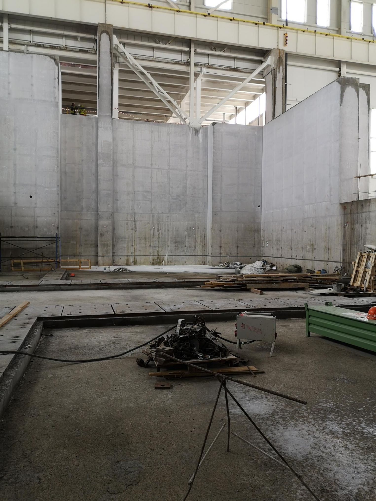
Слева МРД, справа лестница в приямок