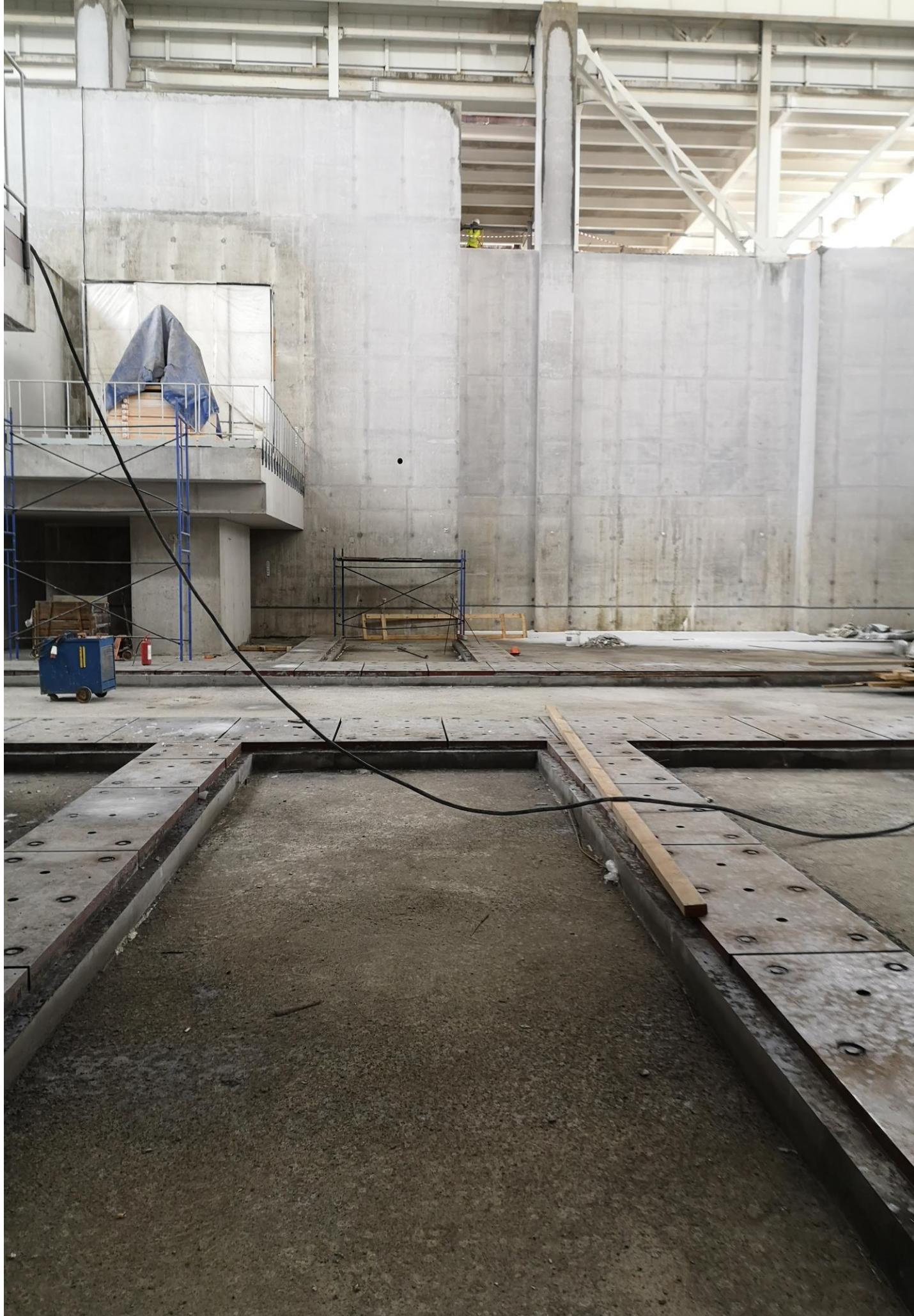
Слева МРД, справа лестница в приямок, в левом верхнем углу будущая ось пучка коллайдера