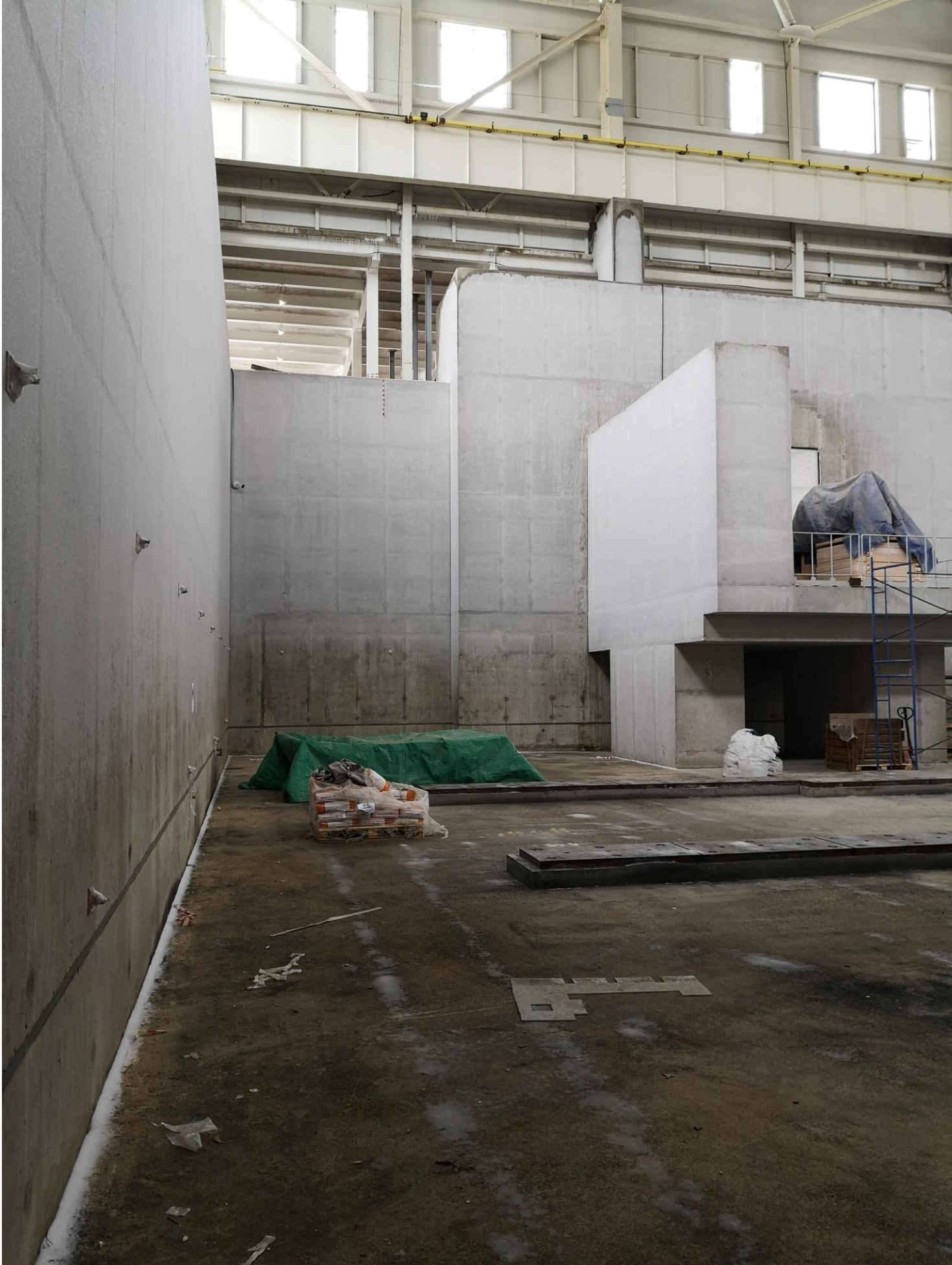
Вид на камеру. Слева внутренняя сторона коллайдера. Балкон 2.