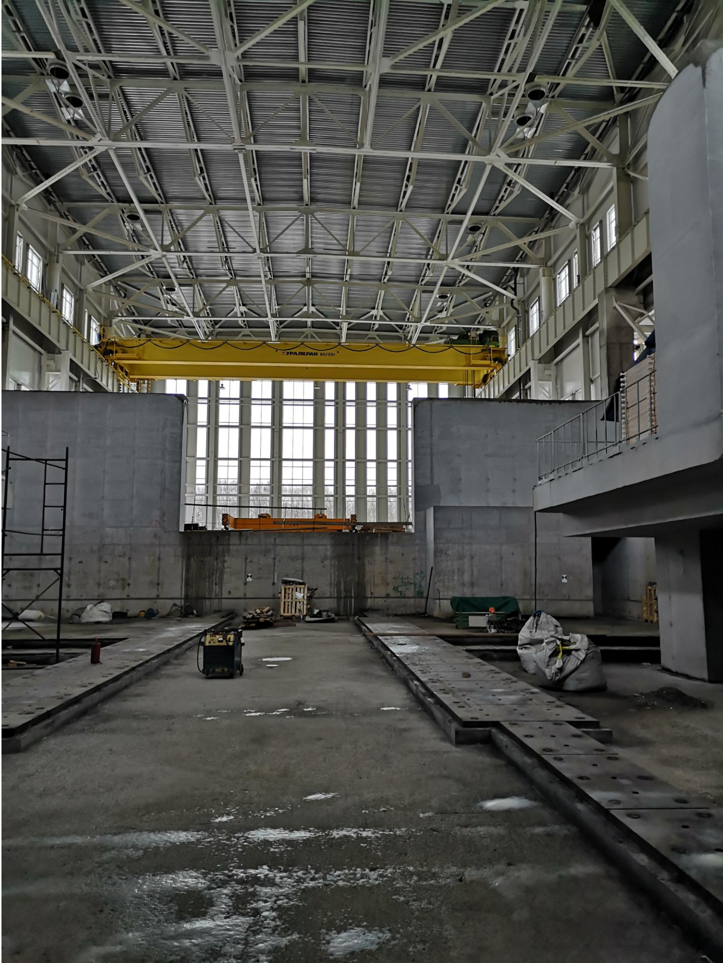
Вид на внешнюю сторону коллайдера и кран в рабочем положении в зоне разгрузок.