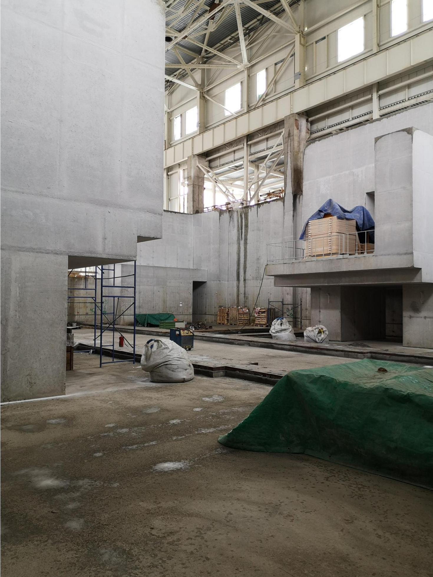
Вид на вход/выход. В правом верхнем углу балкон 1.