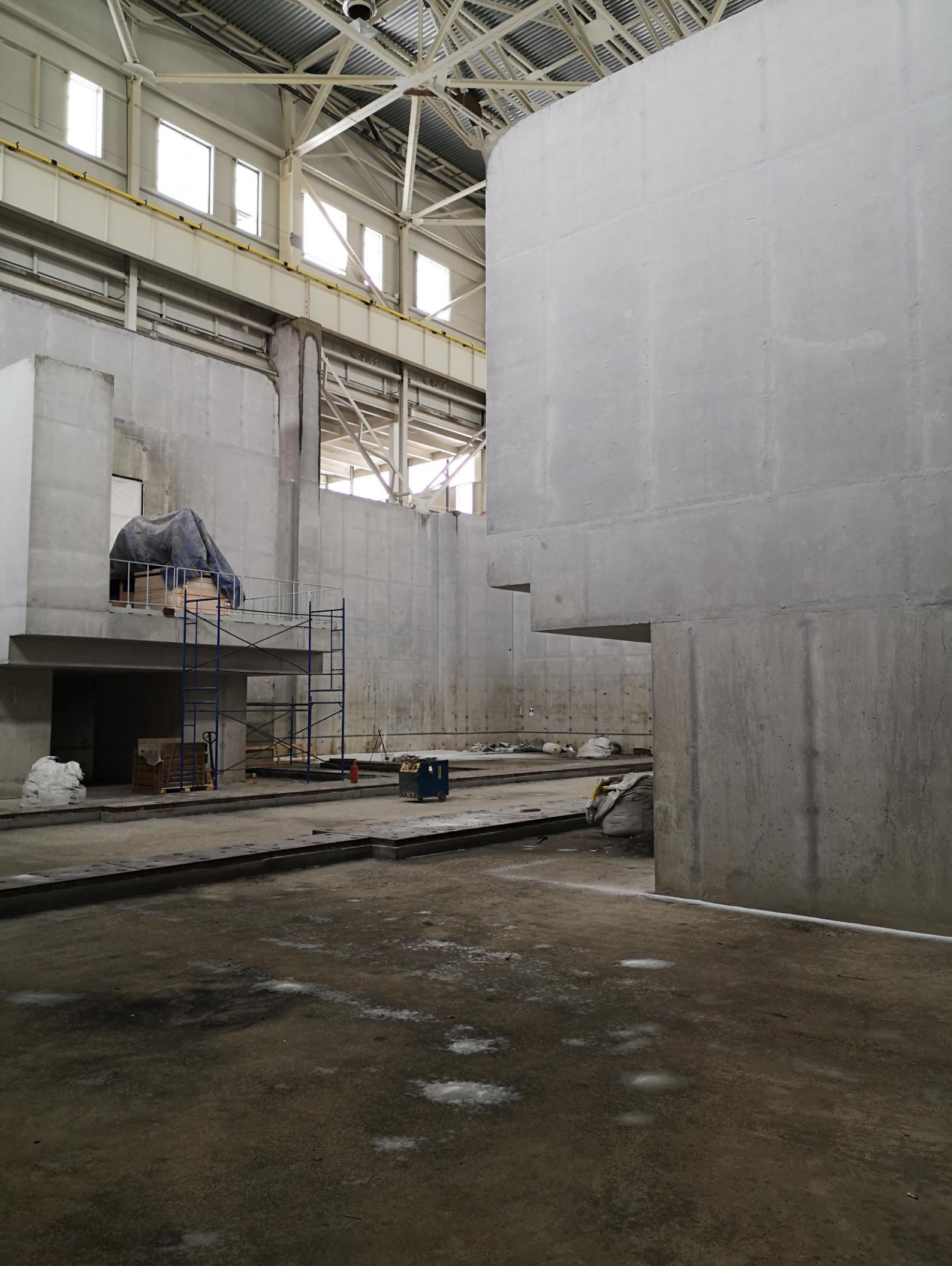
Слева вверху балкон 1. Справа вверху балкон 2.