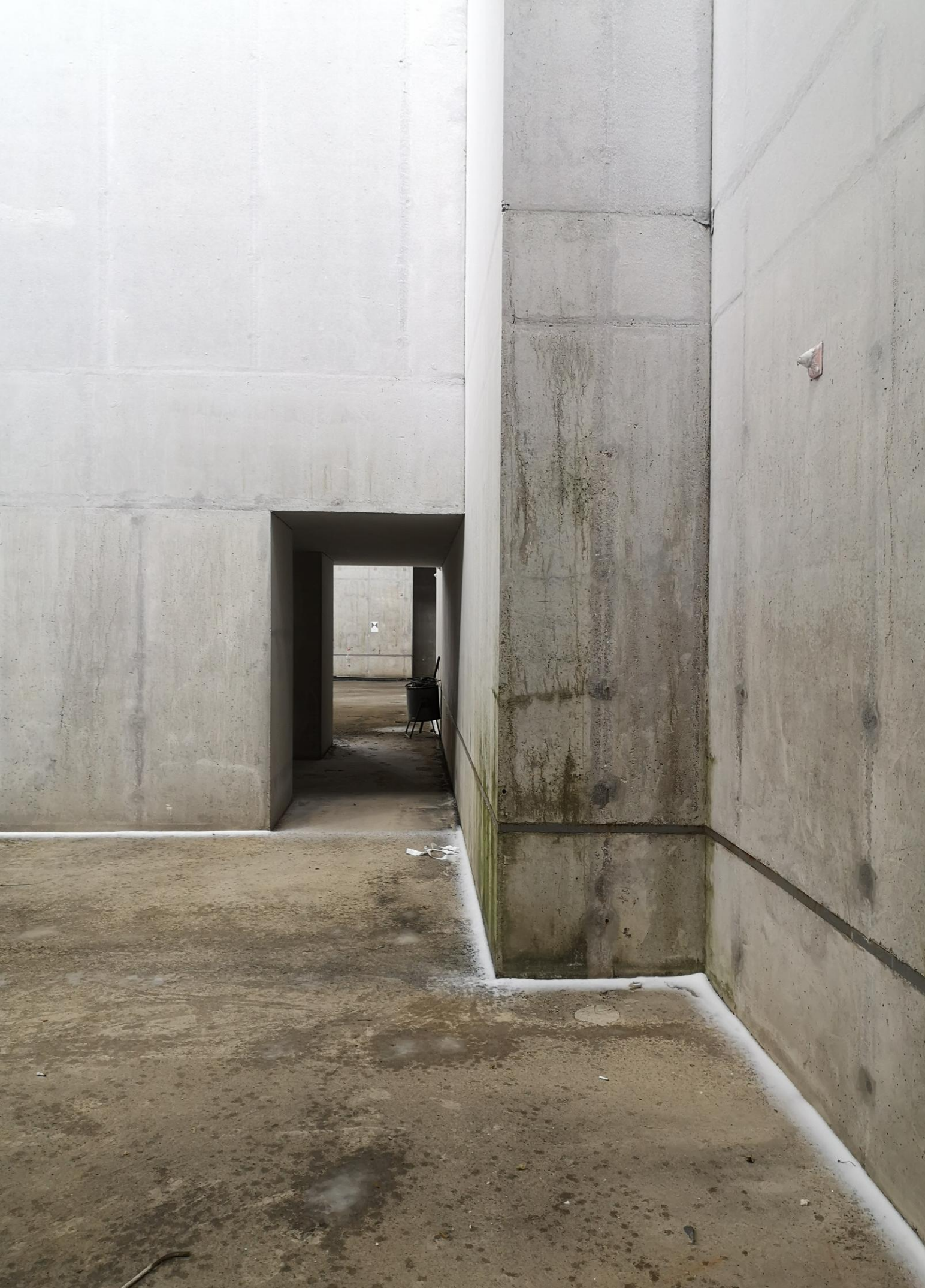
Вид на туннельчик под балконом 2. Прямо внутренняя сторона коллайдера.