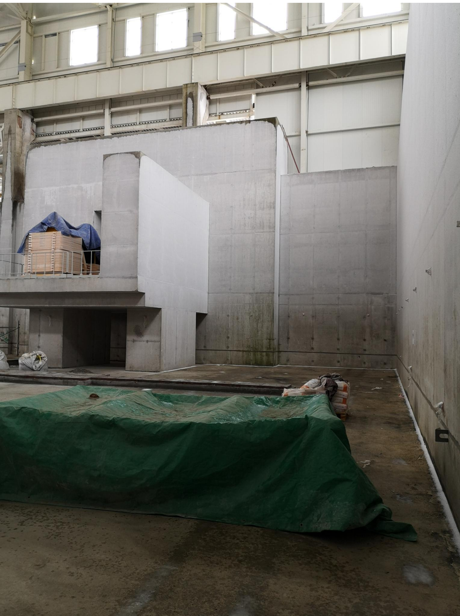
Вид на балкон 1. Справа внутренняя часть коллайдера.