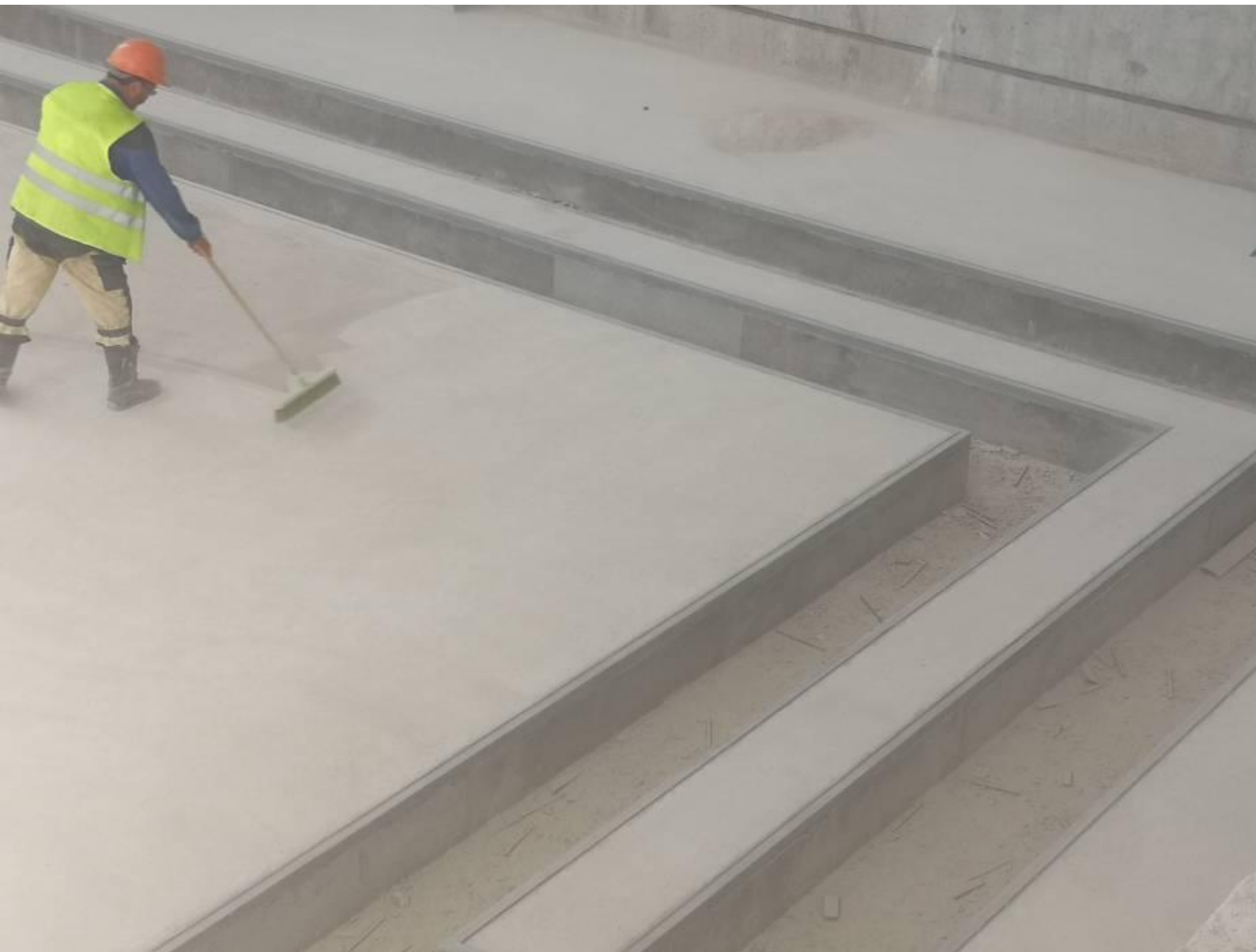
Пыльные работы в прямке зала.