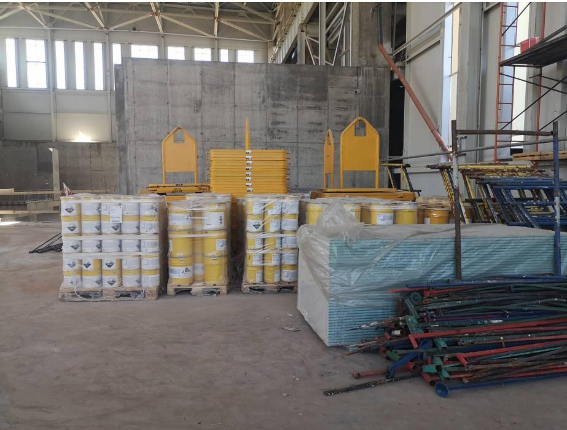
В банках наливные полы.