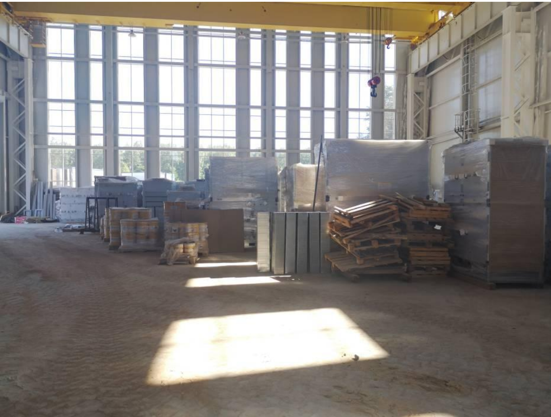
Зал разгрузки используется как склад. Свободного места мало.