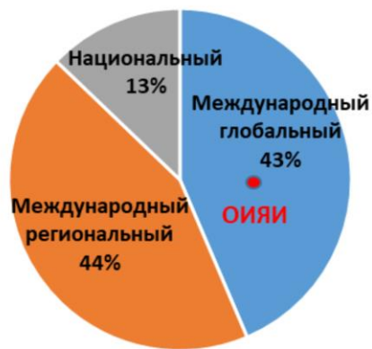
Рис. 1. Распределение крупных научно-исследовательских инфраструктурных проектов по областям науки, миссии и уровню международности. Выборка включает 40 крупнейших научно-исследовательских инфраструктур фундаментальной науки по широкому спектру научных областей, удовлетворяющих критериям большой исследовательской инфраструктуры (сложность, масштабность, уникальность, миссия), как действующих и строящихся, так некоторых планируемых