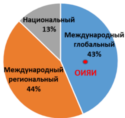
Рис. 1. Распределение крупных научно-исследовательских инфраструктурных проектов по областям науки, миссии и уровню международности. Выборка включает 40 крупнейших научно-исследовательских инфраструктур фундаментальной науки по широкому спектру научных областей, удовлетворяющих критериям большой исследовательской инфраструктуры (сложность, масштабность, уникальность, миссия), как действующих и строящихся, так некоторых планируемых