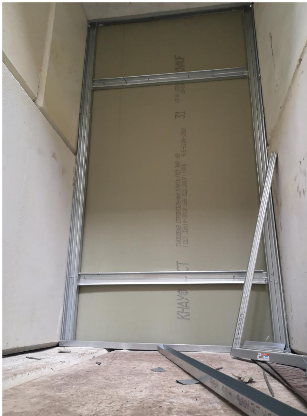
«Дверь» из лабиринта биологической защиты на прямолинейный участок SPD. Уровень 0.