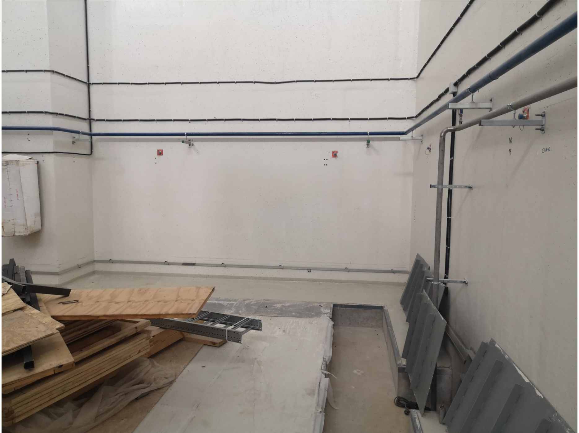
Открытый технологический канал (справа) на отметке -3.190 (прямоук.).