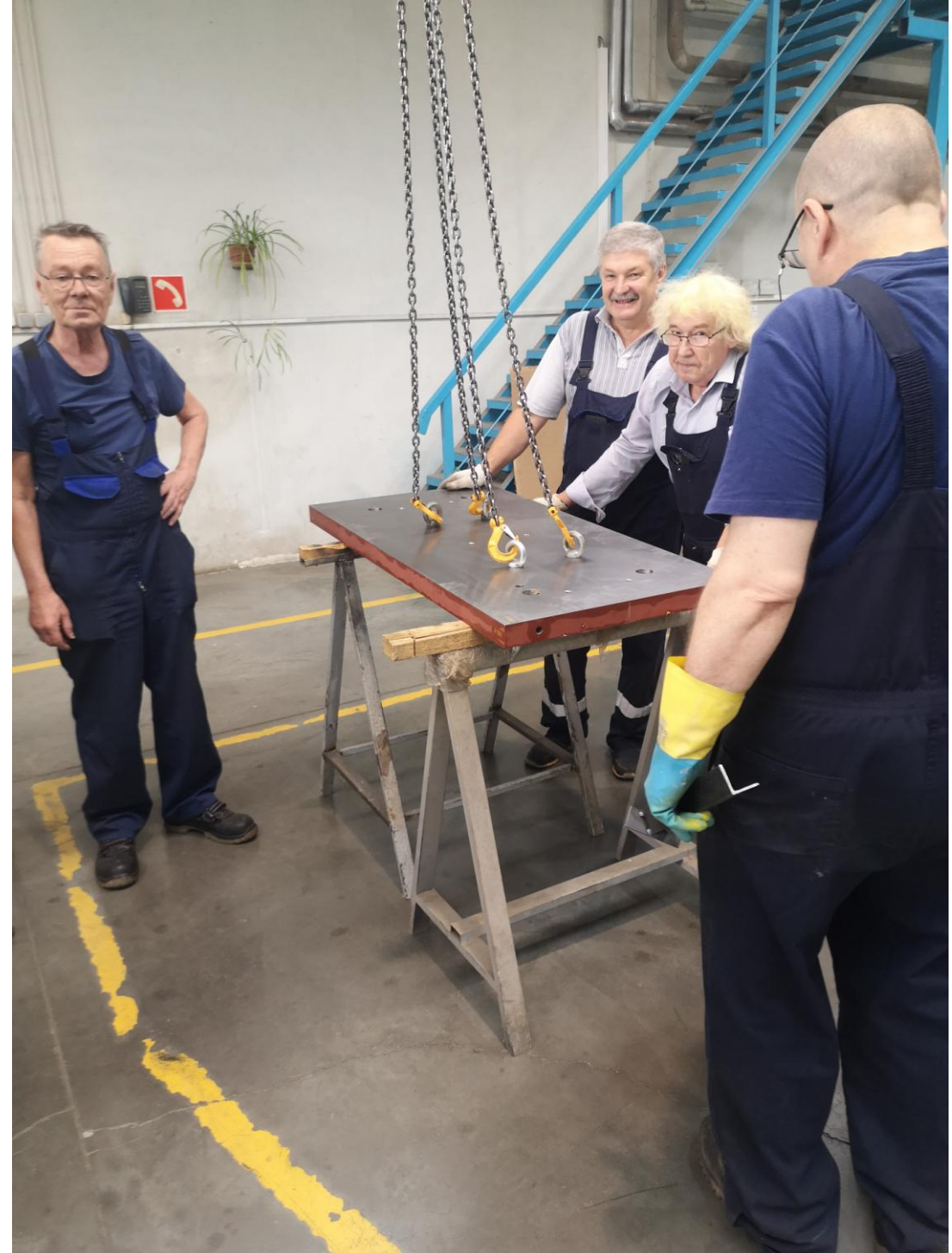
23 августа 2024г. Вывоз плит в «Пелком» для очистки .Работы в «Пелкоме».