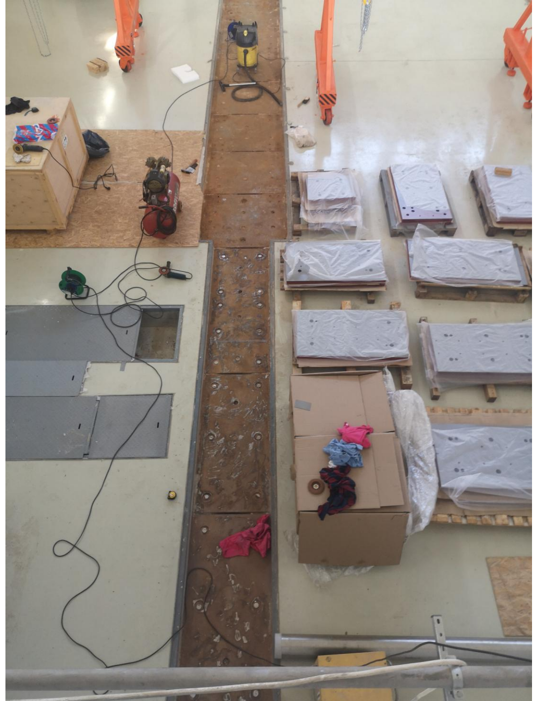
30 августа 2024г. привоз оборудования «Пелкома» в зал SPD. Начало работ с фундаментными плитами.