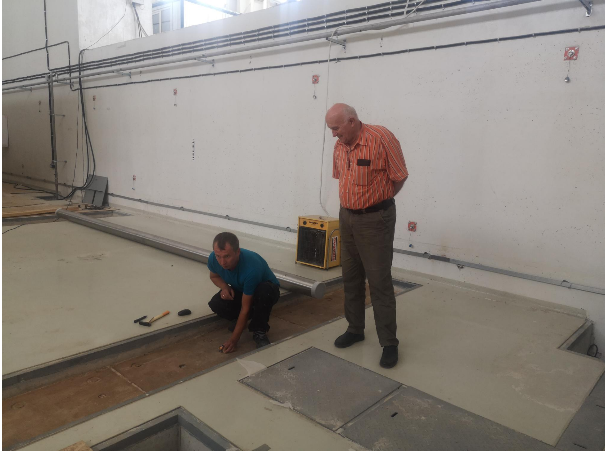
11 июля 2024г. Создание геодезической карты прямка SPD к обновлённой геодезической карте коллайдера. Привязка геодезической карты к рассчитанной точке столкновения пучков.